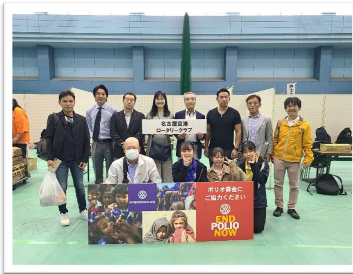
名古屋空港ロータリークラブ エンドポリオ 募金ブース