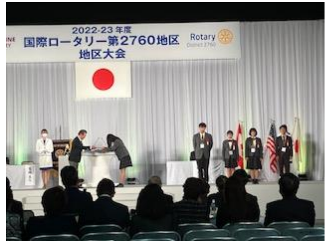
春日丘高校インターアクトクラブ表彰 (「ソーシャル・ビジネス・プロジェクト」における 文部科学大臣賞受賞による表彰)