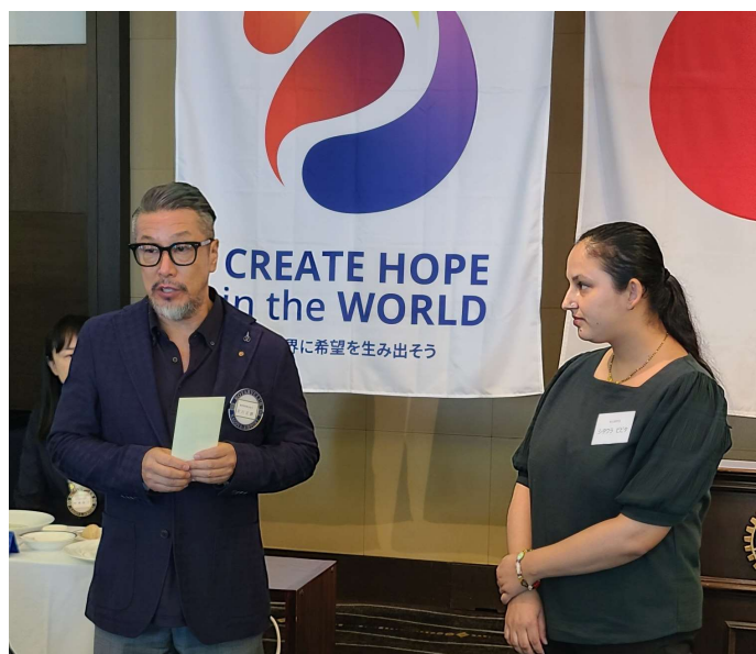
安川カウンセラー