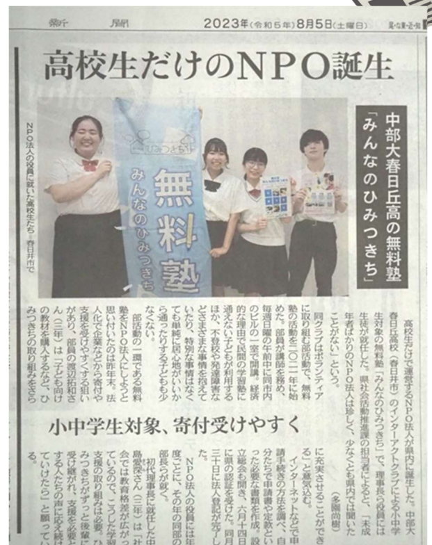
中日新聞 県内版 2023 年 8 月 5 日(土) 掲載