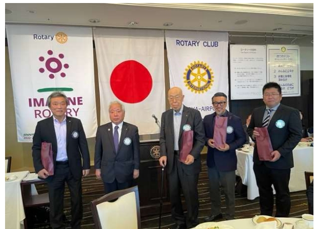
📷 「お誕生日の皆さん」