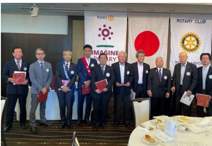
📷 「結婚記念日の皆さん」