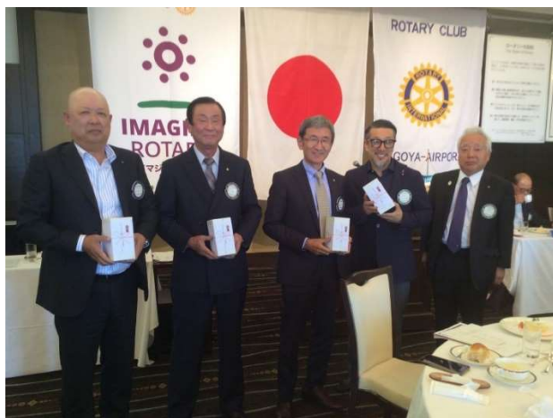
📷 「アテンダンス表彰の皆さん」