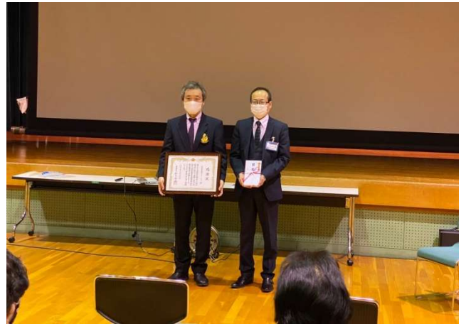
目録贈呈・感謝状授与