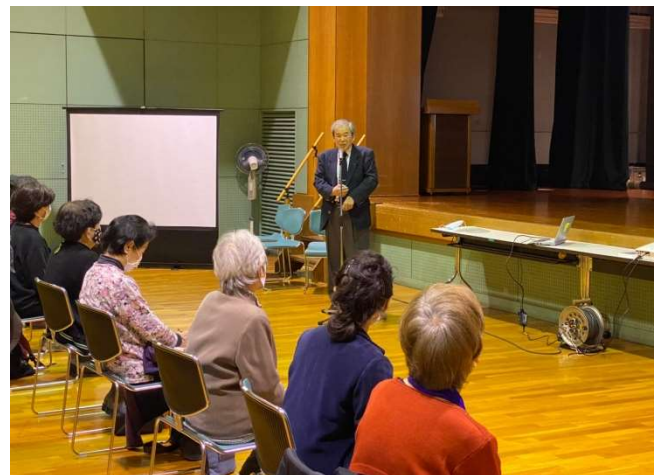
中島社会奉仕委員長より挨拶・説明