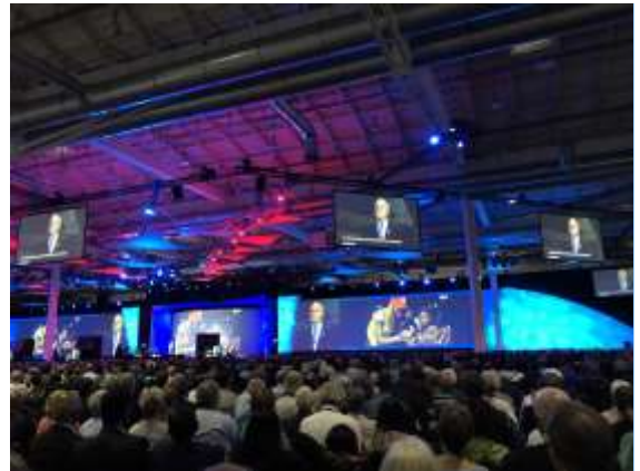
ハンブルグ国際大会メイン会場（ドイツ）