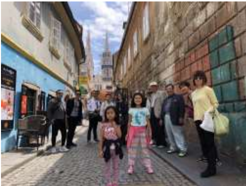
ザグレブ大聖堂（クロアチア）