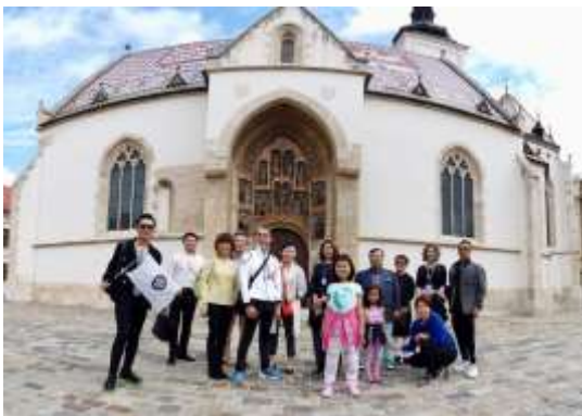
ブダペスト（ハンガリー）