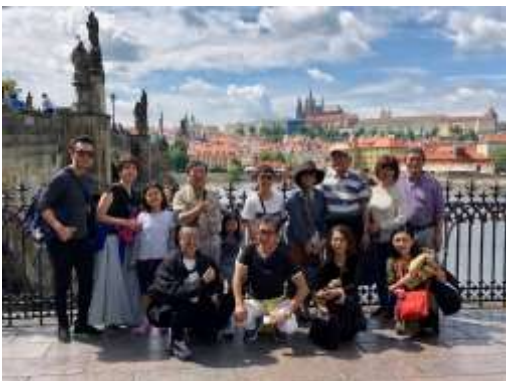
プラハ・カレル橋（チェコ）